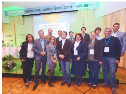
Projekt partnerek a Záró Konferencián

Reméljük, hogy adunk néhány inspiráló ötletet projektjéhez!